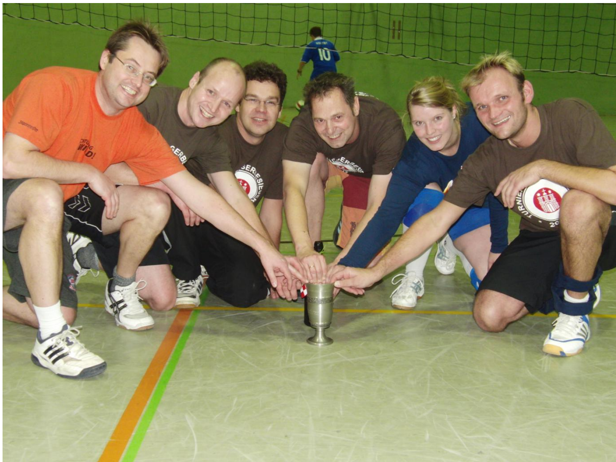
Fliegende Hände Abi 1991 ff. Platz 1