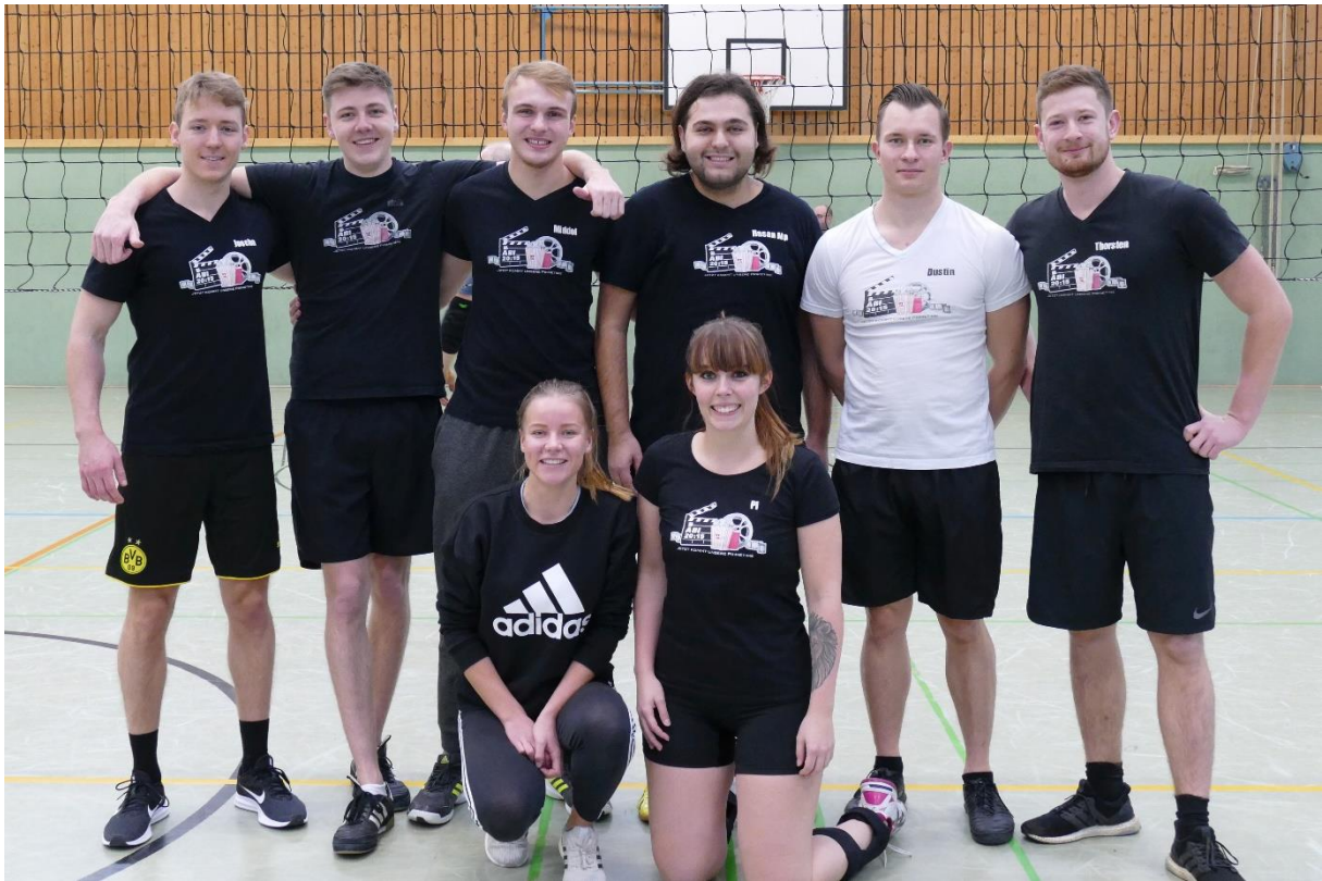
Team Primetime (Abijahrgang 2015)