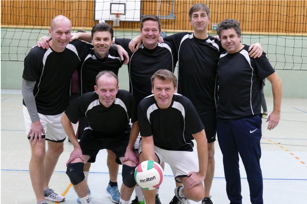
The Last Panthers (Abijahrgänge 1990/1991/1994)