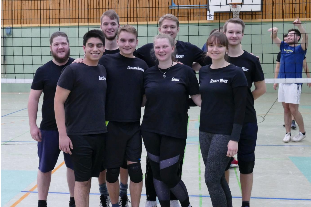
Avergers: Handgame (Abijahrgang 2018)