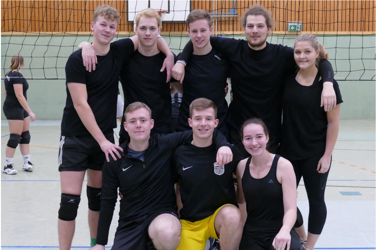
Die WarSteiner (Abijahrgang 2017)