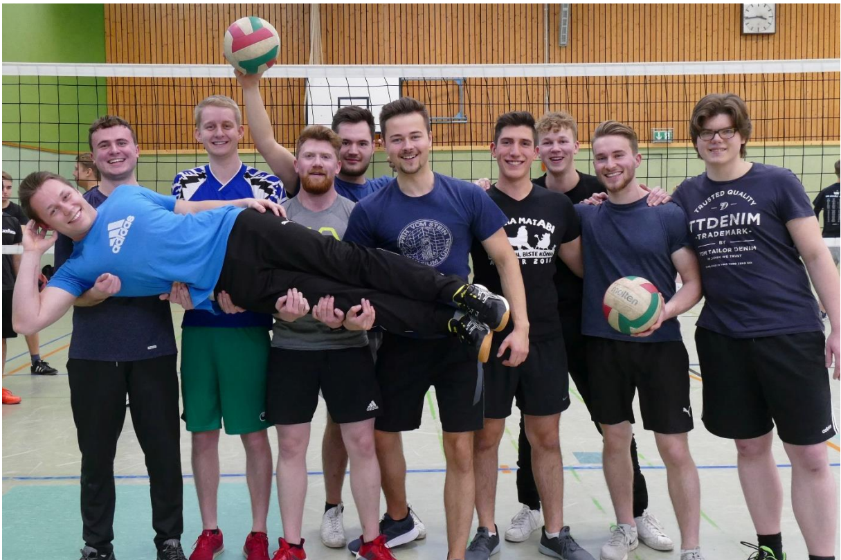
SCHMETTERlinge (Abijahrgang 2016)