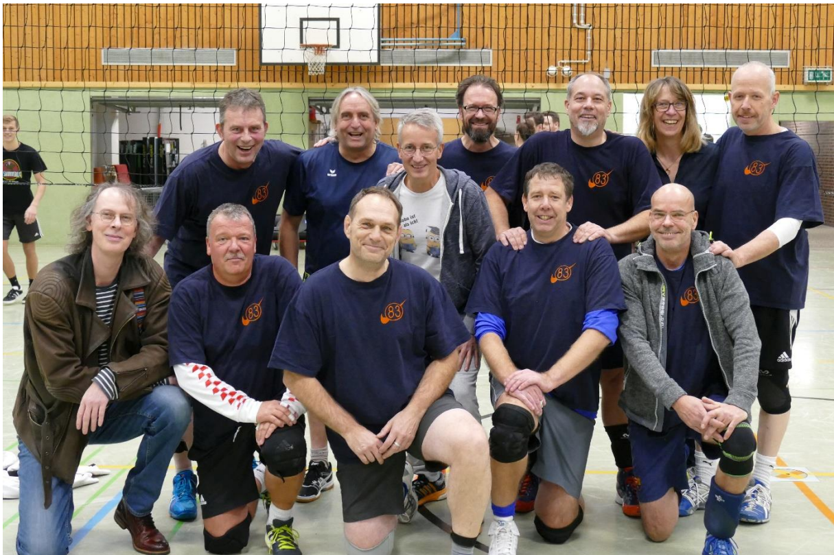
83er Spätlese (Abijahrgänge 1982/83)