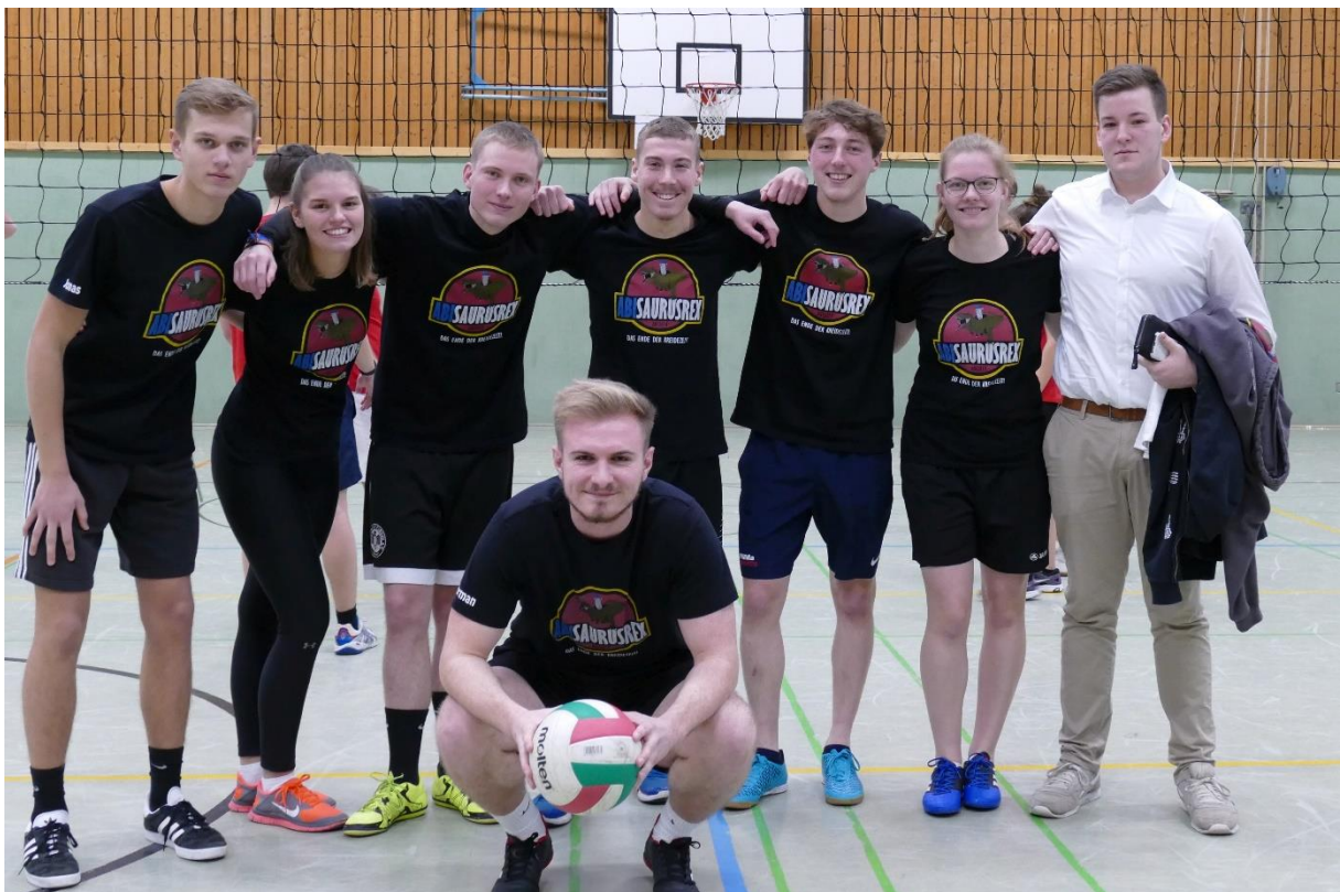
Team Freibier (Abjahrgang 2019)

Die charmanten Volley-Rangers wurden einstimmig zum most-stylished-Team gewählt