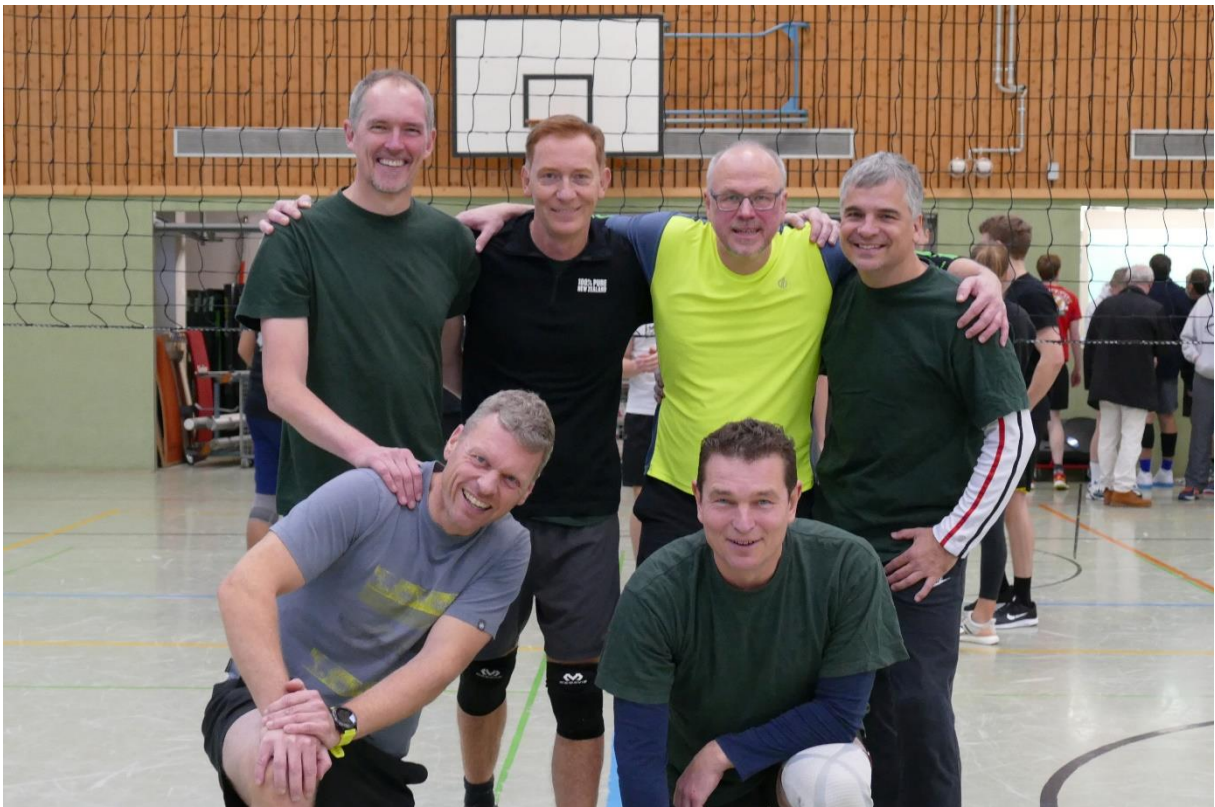
86ziger-Ein Wintermärchen (Abijahrgänge 1986/87)