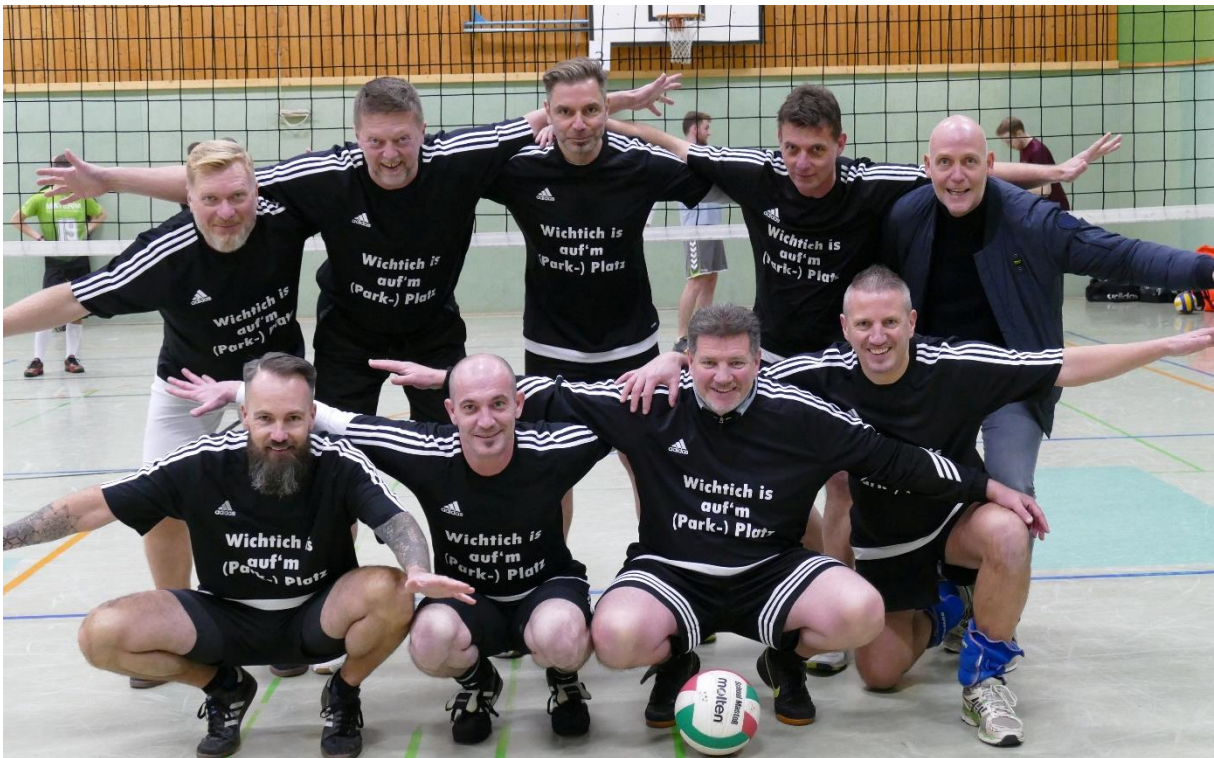
Stein-Eagles (Abijahrgänge 1989 ff)