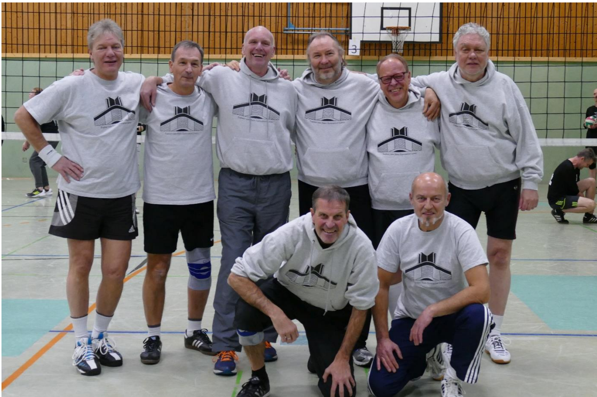
Das Oldie-Dreamteam (Abijahrgang 1979)