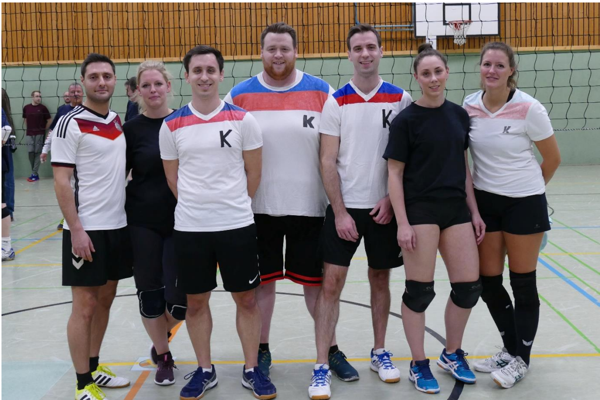
Die Kickers (Abijahrgänge 2008/2010/2011)