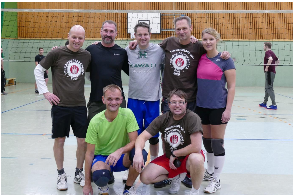
Fliegende Hände (Abijahrgänge 1991/92)