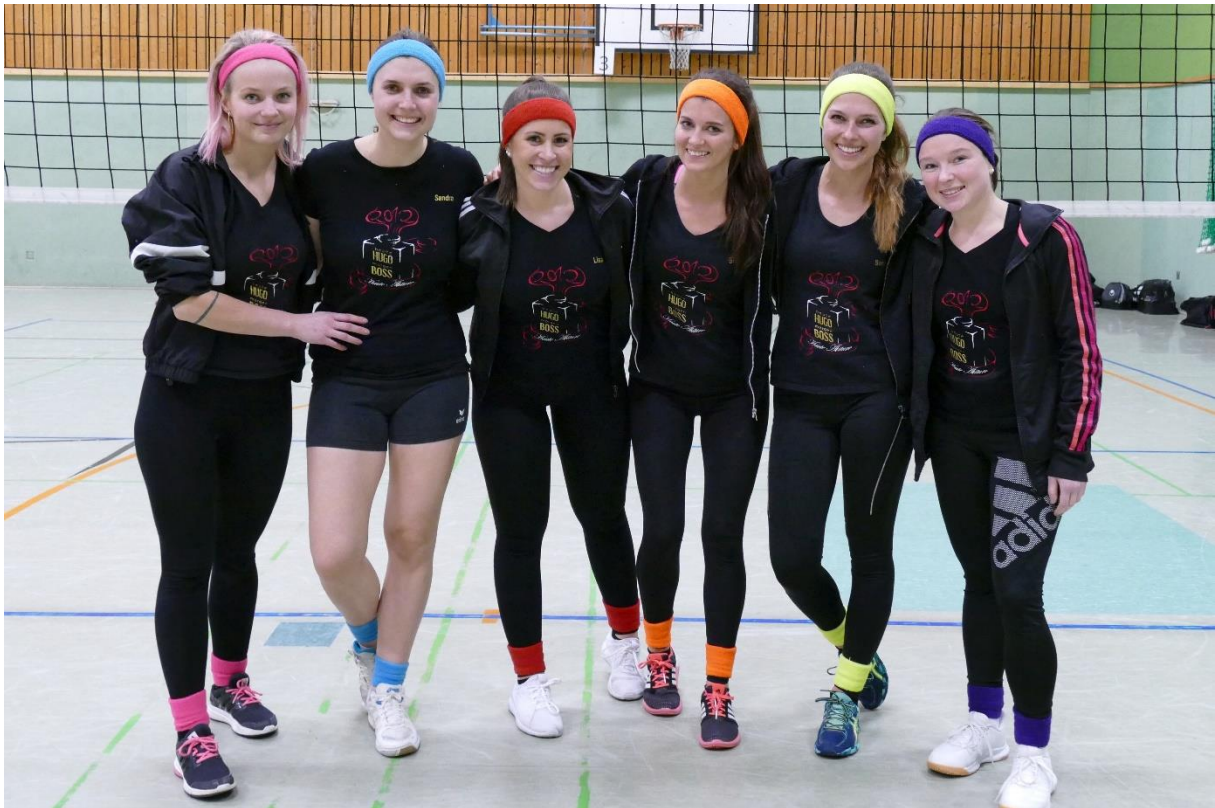
Volley-Rangers (Abjahrgang 2012)

Die charmanten Volley-Rangers wurden einstimmig zum most-stylished-Team gewählt