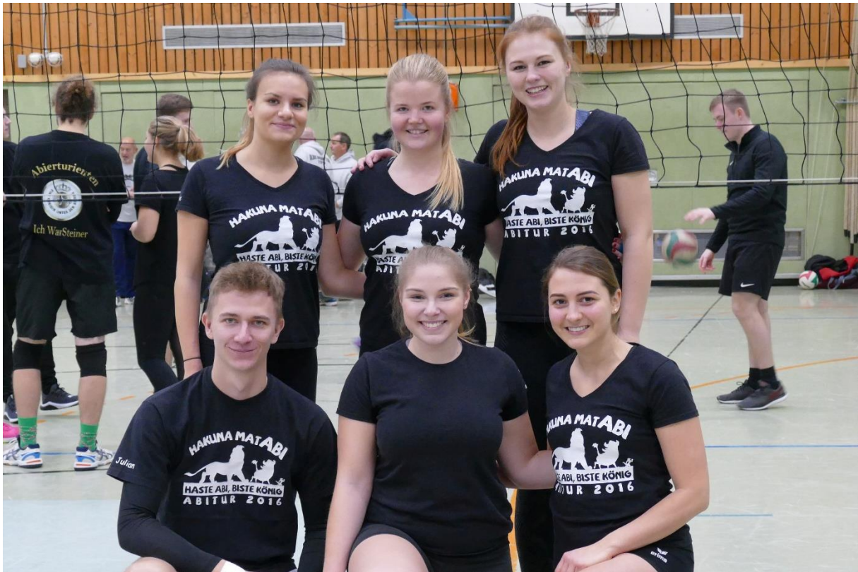
Mut zur Lücke (Abijahrgang 2016)