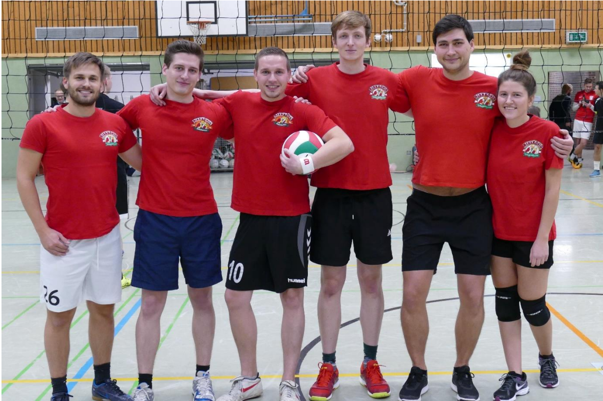
Das Bier gewinnt! (Abijahrgang 2012)