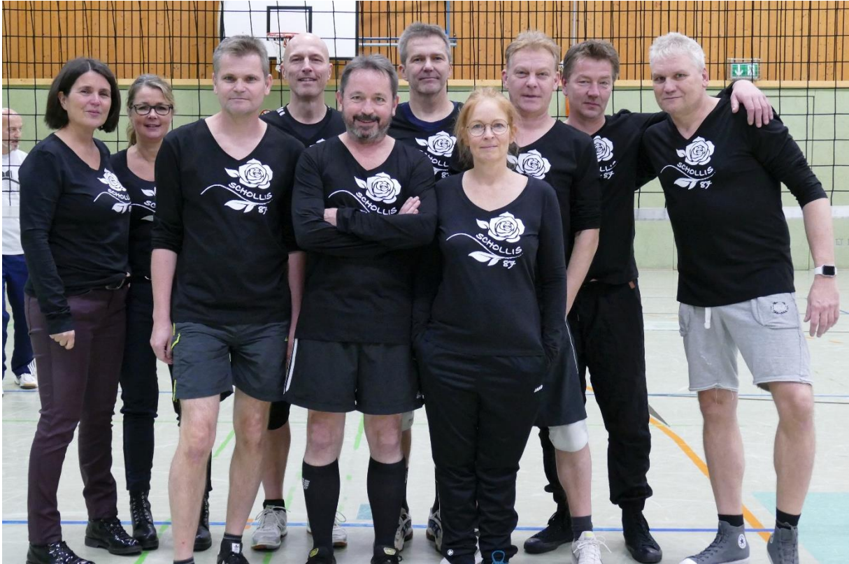
Schollis 87 (Abijahrgang 1987)